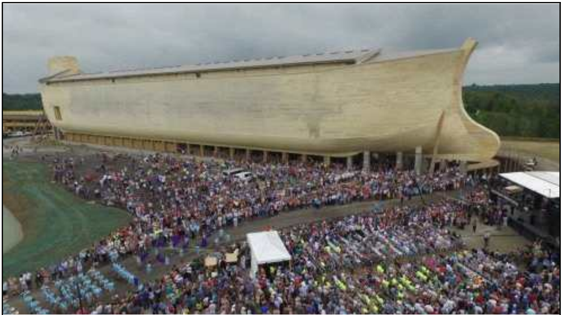
*미국 켄터키주에 있는 노아의 방주 테마파크